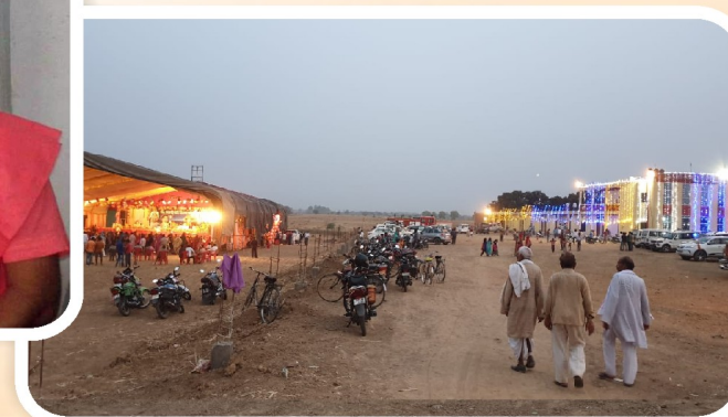
उद्घाटन समारोह के शुभ अवसर पर कथा पंडाल एवं महाविद्यालय