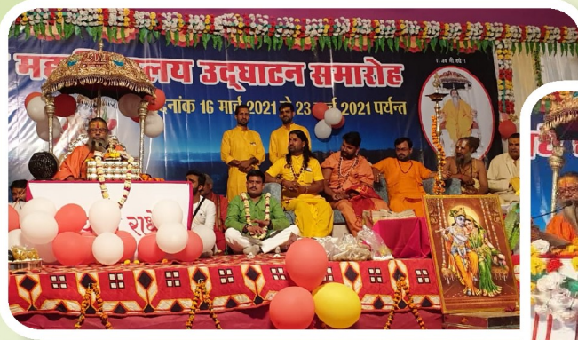
महाविद्यालय उद्घाटन समारोह के शुभ अवसर पर मंचासीन पूज्य संत वृन्द